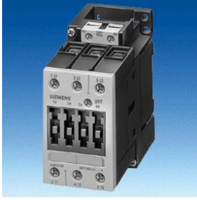
JPG-Bild zu 3RT10 1 (verlinktes JPG-File)

Kombination von Daten aus ProFree, dem Zeitbausteinkatalog und "verlinkten" Herstellerdaten aus dem Internet und der Anschlussdatenbank am Beispiel des Siemens-Schützes 3RT1015-1AP01